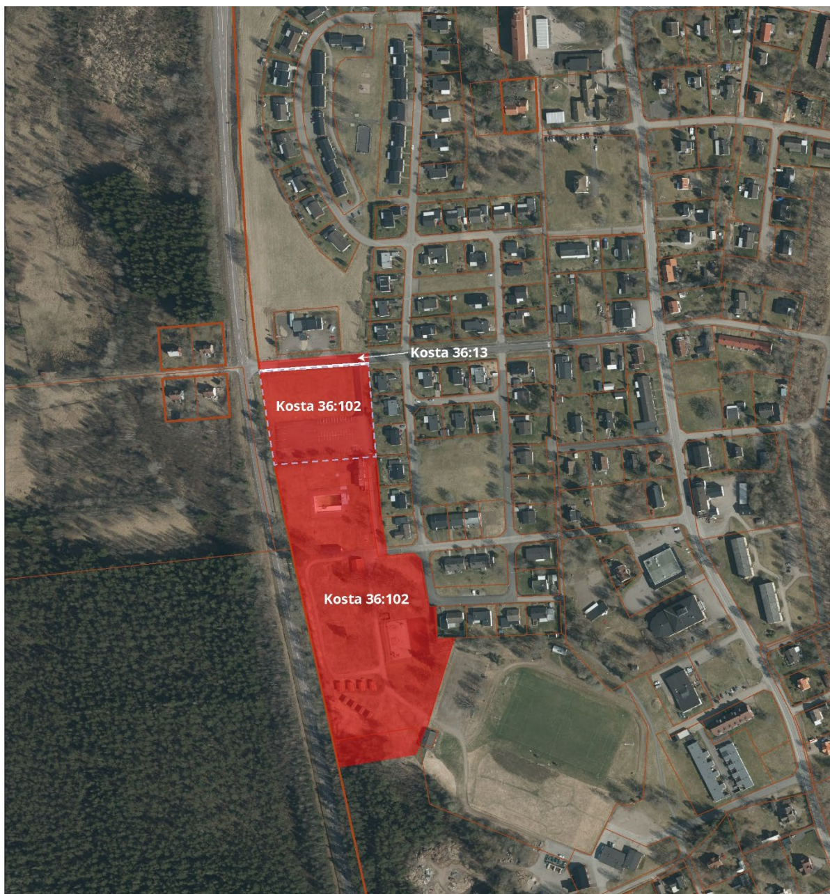
Lokalisering av planområdet