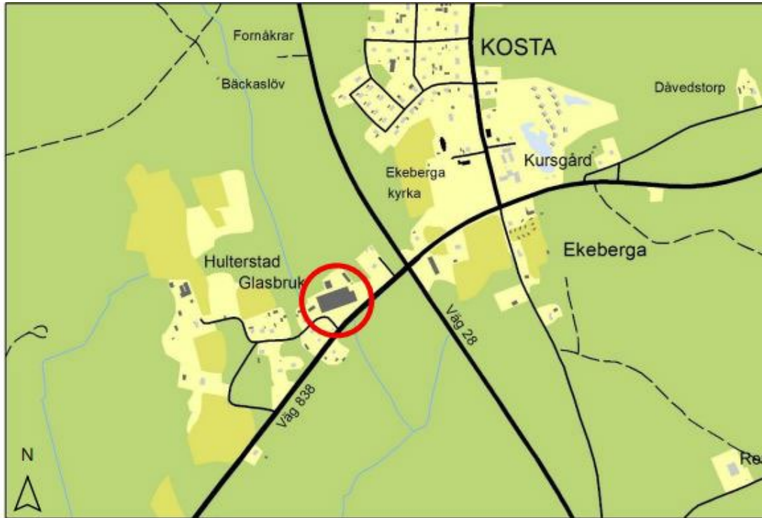
Översiktskarta med planområdet markerat med en röd cirkel.